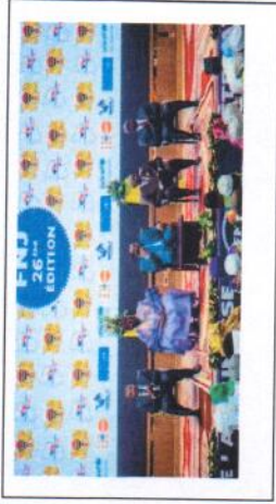
Une vue des personnalités qui ont pris part à la cérémonie d'ouverture