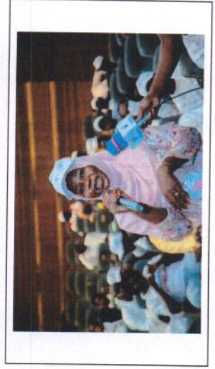
Une vue des participants aux différents panels